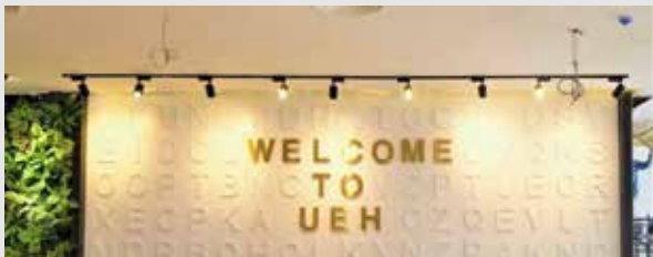
Thư viện Đại học Kinh tế Thành phố Hồ Chí Minh (Cơ sở B)