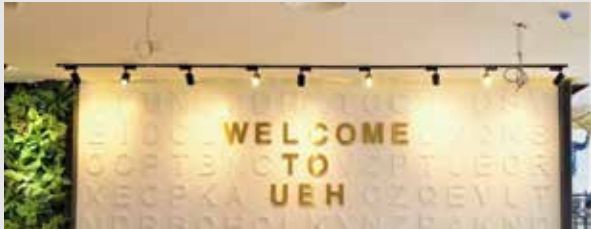
Thư viện Đại học Kinh tế Thành phố Hồ Chí Minh (Cơ sở B)